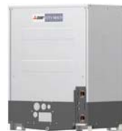
PQRY-P200YLM-A1 PQRY-P250YLM-A1 PQRY-P300YLM-A1