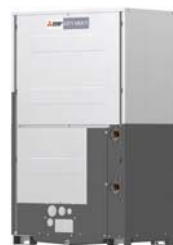
PQRY-P350YLM-A1 PQRY-P400YLM-A1 PQRY-P450YLM-A1 PQRY-P500YLM-A1 PQRY-P550YLM-A1 PQRY-P600YLM-A1