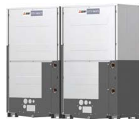
PQRY-P700YSLM-A1 PQRY-P750YSLM-A1 PQRY-P800YSLM-A1 PQRY-P850YSLM-A1 PQRY-P900YSLM-A1