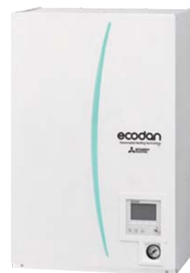
Тепловые насосы (наружные агрегаты)