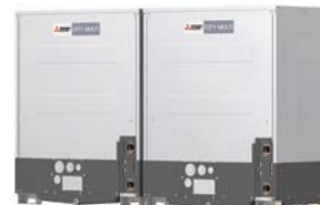
PQHY-P400YSLM-A1 PQHY-P450YSLM-A1 PQHY-P500YSLM-A1 PQHY-P550YSLM-A1 PQHY-P600YSLM-A1