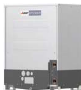
PQHY-P200YLM-A1 PQHY-P250YLM-A1 PQHY-P300YLM-A1